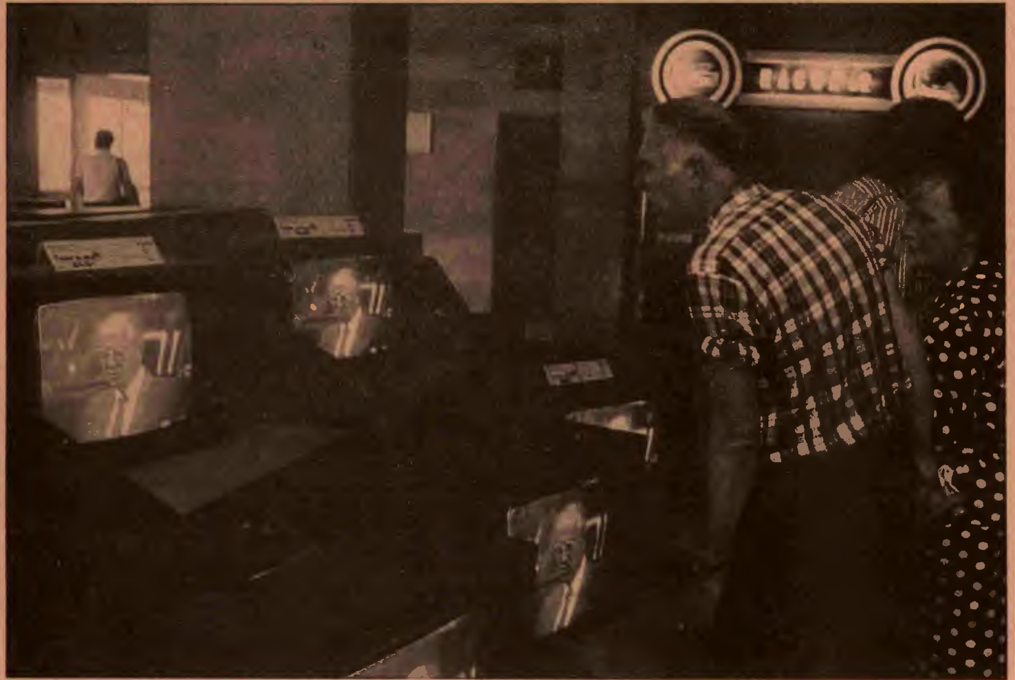
“Yine neler diyor acaba?”

uygarlığın yıkılışının eşiğine getirdiğini” (agy, c.24 s.86) vurgularken, sorunun emperyalist-kapitalizmin varlığı ile bağımlı koyuyordu.