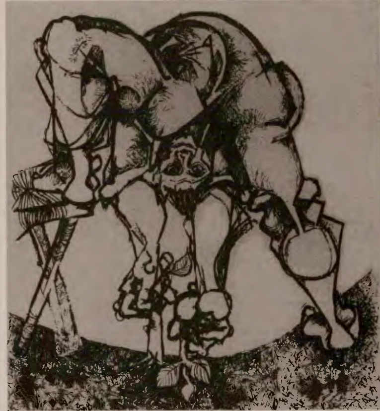
S.Erek 1981, Başsağı anılayış

"... Komünist toplumda devlet ve para kalkacaktır. Bundan dolayı onların giderek ölmesi sosyalizm altında başlamıştır. Sosyalizmin gerçek zaferinden, yalnızca devletin yarı-devlet haline geldiği, paranın sihirli gücünü yitirmeye başladığı o tarihsel anda bahsedebiliriz... Para gelişigüzel 'lağvedilemez', devlet ve eski aile de 'likide edilemez'. Kendi tarihsel misyonlarını tamamlamalı, buharlaşmalı ve yok olmalıdırlar..."