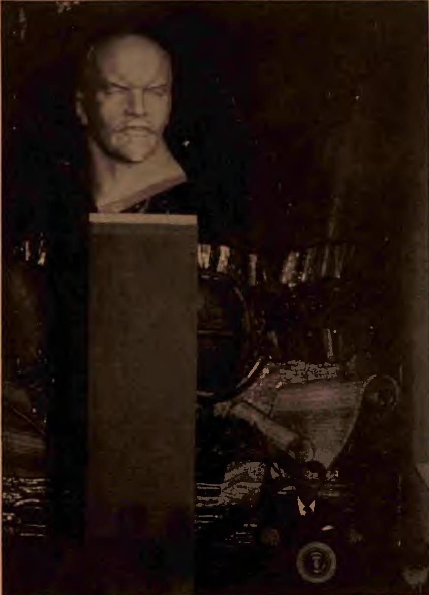
Bu gidişle yakında yalnız kaşlar değil, silahlar da çatılacak.

Gorbaçov'un yukarıda verdiğimiz alıntıda söylediklerinden şöyle bir manzara çıkıyor: Dünya bugün geçmişe göre çok farklı bir yerdedir. Bu noktada "insanlık", ölüm kalım sorunuyla, kendini koruma sorunuyla karşı karşıyadır. Neden? Çünkü, a) nükleer bir savaş insanlığı yok edecektir, b) dünya ekolojik bir felakete doğru gidiyor, c) bunların yanı sıra ve en az bunlar kadar önemlisi, emperyalist ülkelerle geri kalmış ülkeler arasındaki uçurum giderek büyüyor, toplumsal kutuplaşma artıyor ve bunun sonucunda da "çalkantılı halk hareketleri" ortaya çıkı-